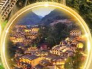
ดื่มด่ำบรรยากาศสุดพิเศษ พร้อมพิทักษ์ในหุบเขา