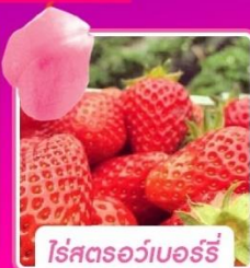
โรสตรอว์เบอร์รี่