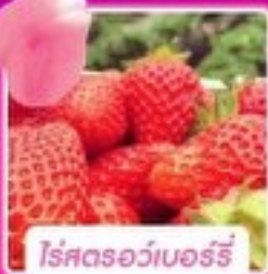
โรสตรอว์เบอร์รี่