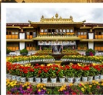
ตำหนักนอร์นุหลินมา

ชมวิวยอดเขานานเจียปาหว่า / จุดชมวิวกะเลป่าหลู่หลาง / อุทยานเขาเป็นยี่ / ระเบียบกระจก / วัดลามะ พระราชวังโปตาลา / วัดโจคัง / ถนนแปดเหลี่ยม / ทะเลสาบนำมูเซว / ตำหนักนอร์นุหลินมา / เมืองโบราณลั่วใต้