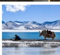
ทะเลสาบนำมูเซว