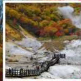
หุบเขานรก จิโคะคุดามิ