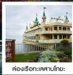
ล่องเรือทะเลสาบโทยะ