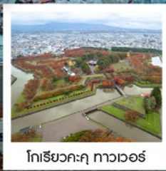
โทริยวคะคุ ทาวเวอร์

PERIOD 1 : 21 - 26 ต.ค. 67 | PERIOD 2 : 23 - 28 ต.ค. 67