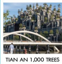
TIAN AN 1,000 TREES