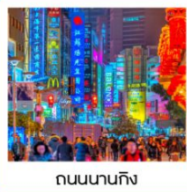
ถนนนานกิง