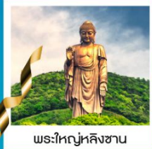
พระใหญ่หลิงซาน

วัดพระใหญ่หลิงซาน / ศาลาฟานกง / จตุรัสหยวนหลง / เมืองโบราณผานหลงกุจิ้น / Tian An 1,000 Trees Square / ตลาดดิ้งหวังเมี่ยว สวนสนุกเซียงไฮ้ดิสนีย์แลนด์เต็มวัน / ถ่ายรูปหอไข่มุก / ลอดอุโมงค์เลเซอร์ / ถนนนานกิง / หาดไว่ทาน / STARBUCKS RESERVE ROASTERY