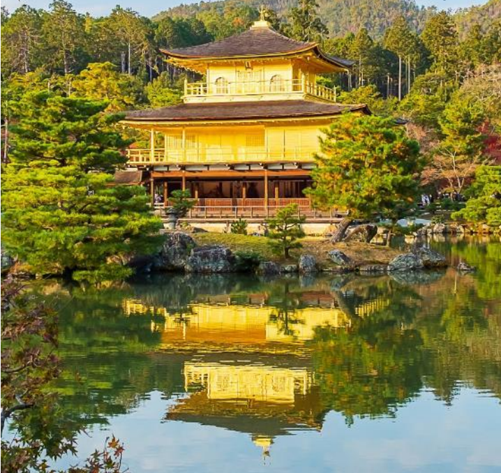
แลนด์มาร์คแห่งเกียวโต ปราสาททองคิงคะคุจิ