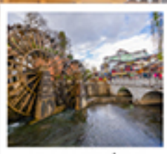
ເມືອງໂບຣາດສີ່ເຈີຍງ