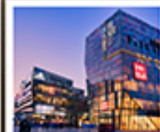
ย่านซานหลี้ถุน