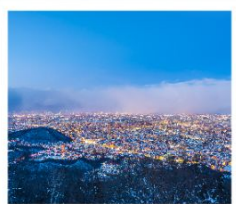
ภูเขาโมอิวะ