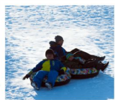
บิโอบ สโนว์แลนด์