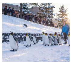
สวนสัตว์อาซาฮิยาม่า

โรงงานขนมหวานริวเกิตสึ / LAKE AKAN SNOW ACTIVITY ทะเลสาบมะซุ / ล่องเรือตัดน้ำแข็ง / สวนสัตว์อาซาฮิยาม่า บิโอบ สโนว์แลนด์ / ภูเขาโมอิวะ / ตลาดซังคะกุ / พิพิธภัณฑ์หอคองดนตรี นาฬิกาไอน้ำโบราณ / โรงเป่าแก้วคิตาฮิชิ / มิซุยะ เอ้าเล็ทต์ ถนนช้อปปิ้งทานุกิโคจิ / ย่านซูซุกิโนะ