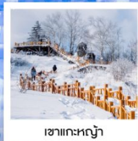
เขากระหลว้า