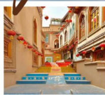
เมืองโบราณคัชการ์