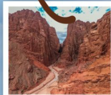
แกรนด์แคนยอนเทียนชาน