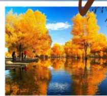
สวนต้นหูหยาง

พิธีเปิดเมืองเก่า / เมืองโบราณคัชการ์ / มัสยิดอิดคาห์ / ถนนคนเดินHandmade / โรงน้ำชาอ๋อयी / ทะเลสาบไ้ซาหุ / ทะเลสาบคาลาคู่เค่อ ภูเขาหิมะ: Muztagh Peak / ทะเลทรายทากลามากัน / จุดชมวิวทะเลแดง / แกรนด์แคนยอนเทียนชาน / สวนต้นหูหยาง / สวนหลงชาน / ตลาดต้าปาจา