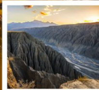
แกรนด์แคนยอนตูซันจื่อ