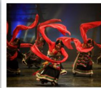
โชว์ทิเบต