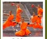
โงวี่เล่าหลิน

กำแพงเมืองโบราณซีอาน / วัดลามะ / ตลาดมุสลิม อุทยานหยุนโกซาน / ศาลเจ้ากวนอู / ถ้ำหินหลงเหมิน วัดเล่าหลิน / ป่าเจดีย์ / โชว์การแสดงวิทยายุทธเล่าหลิน สุสานทหารจีนซี / ถนนคนเดินวัฒนธรรมต้าถิง / โงวี่ราชวงศ์ถัง