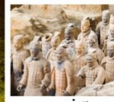
สุสานจีนซี