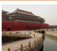
พระราชวังกุ่กิง