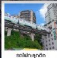
ต๋อไฟท์ช้อปปิ้ง

ทัวร์คุณภาพ ไปลงร้านช้อปปิ้ง • ไปช้อปปิ้ง