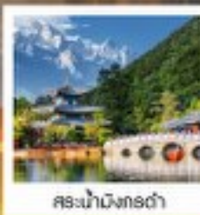
สถานีรถไฟต้าลี่