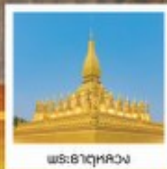
พระธาตุหลวง

อุดร / เวียงจันทน์ / ต้าลี่ / ลี้เจียง / กุหนิง