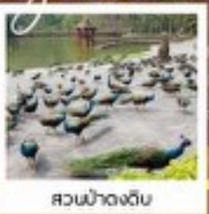
สวนป่าดงดิบ