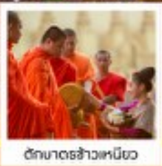
วัดมหาธาตุหลวง