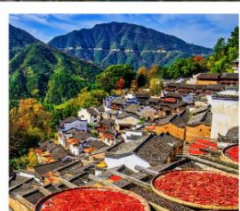
หมู่บ้านหวงหลิ่ง