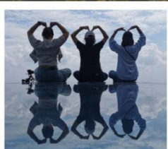
เขาหลิงซาน