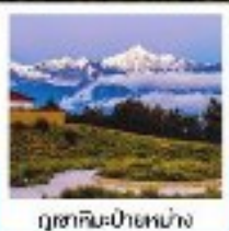
ภูเขาหิมะไป๋หม่าง