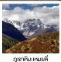
ภูเขาหิมะหน่าบ๋อตี้