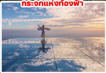
กระบอกแห่งท้องฟ้า