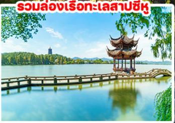
รวมล่องเรือทะเลสาบซีหู