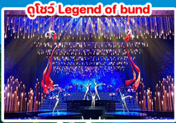
ดูโชว์ Legend of bund