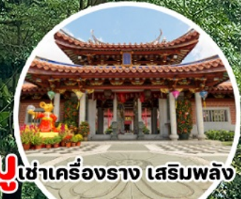
บู เข้าเครื่องราง เสริมพลัง Lian Shan Shuang Lin Temple