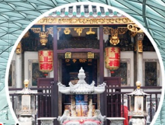
บู เรื่องรัก ขอบครอบครัว ขอลูก Yueh Hai Ching Temple

ทัวร์สิงคโปร์ 3วัน 2 คืน โดยสายการบิน Thai Lion Air (SL)