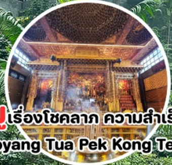
บู เรื่องโชคลาภ ความสำเร็จ Loyang Tua Pek Kong Temple