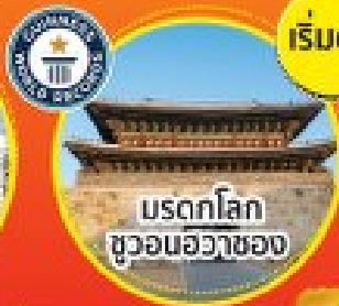
มรดกโลก ชวอนฮวาซอง