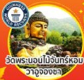
วัดพระบอนไม้จันทร์หอม วาจุงองชกา