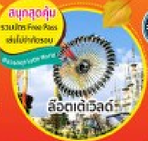
สนุกสุดคุ้ม รวมบัตร Free Pick ขึ้นไปเที่ยวชม