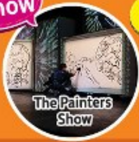
The Painters Show