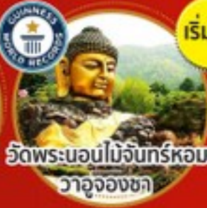
วัดพระนอนไม้จันทร์หอม วาจุงงซา