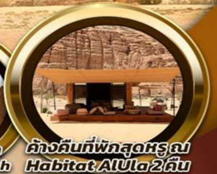
ค้ำคืนที่พักสุดหรู Habitat AlUla 2 คืน

🎯 พิเศษ!! รับประทานอาหาร ณ ภัตตาคารอาหารไทย สุดหรูและไฮโซ @Saffron Banyan Tree AlUla