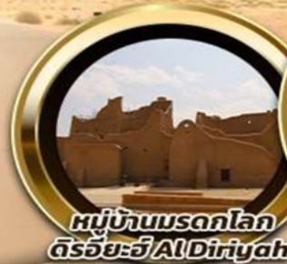
หมู่บ้านมรดกโลก ดิริยะฮ์ AlDiriyah

บินหรู อยู่สบาย เทียบชิด ชิลด์ 10 ท่าน คอนเฟิร์มเดินทาง