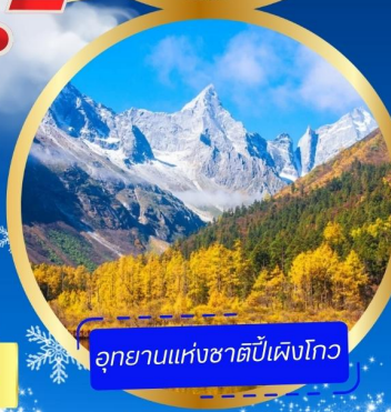
อุทยานแห่งชาติหนีเฟิงโกว