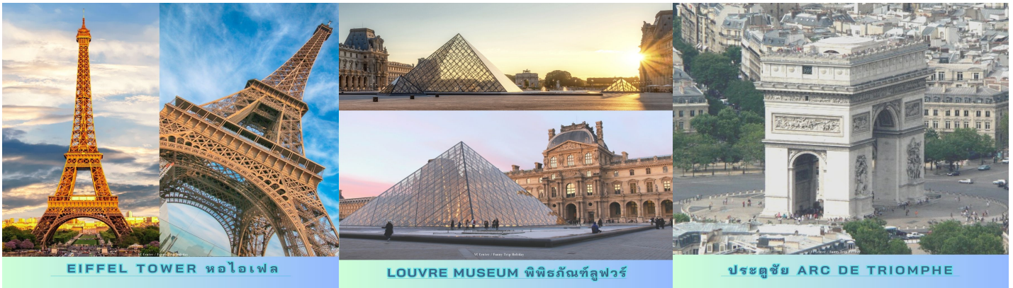
EIFFEL TOWER หอไอเฟล

นำท่าน ชมหอไอเฟล (EIFFEL TOWER) ซึ่งเป็นสัญลักษณ์ของกรุงปารีส เลิศหรู อลังการ โรแมนติก มหัตศจรรย์ ด้วยความสูง 984 ฟุต สร้างด้วยโครงเหล็กทั้งหมด...ถนนชองเซลีเซ (CHAMPS-ELYSEES) ถนนที่มีต้นไม้เรียงรายทั้งสองข้างทางอย่างน่าเดินเล่น ต้นแบบถนนราชดำเนิน ปลัซเดอลา คอนคอร์ด์ (PLACE DE LA CONCORDE) จตุรัสแห่งความสามัคคี โบสถ์แมดดิแลน ที่สร้างแบบกรีกโบราณ ถ่ายรูปกับปิระมิดหน้าพิพิธภัณฑ์ลูฟวร์ หรืออดีตพระราชวังลูฟวร์ จากนั้นนำท่าน ชมเมืองปารีส มหาราชินีแห่งเมืองหลวงของโลก ..ถ่ายรูปคู่กับประตูชัย (ARC DE TRIOMPHE) ของพระเจ้านโปเลียนอาร์ค เดอทรออม ให้ท่านช้อปปิ้งสินค้าแบรนด์เนมที่มีชื่อเสียง ณ ห้างเกอลอรัลลาฟาแยส เช่น หลุยส์,