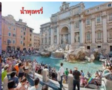
น้ำพุเทรวิ