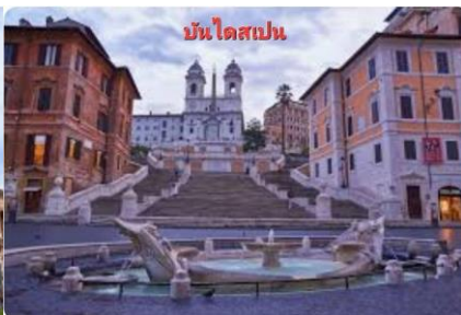
บันไดสเปน