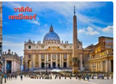
วาติกัน เซนต์ปีเตอร์

บ่าย ...ชม น้ำพุเทรวิ จุดกำเนิดของเสียงเพลง ทร็อคอย่นอฟอร์ดอร์ฟาวด์เท่น ที่โด่งดัง ชมความสวยงามของงานประติมากรรมหินอ่อนแบบบาร็อค ซึ่งเป็นเรื่องราวของเทพมหาสมุทร ตามตำนานกล่าวไว้ว่าหากใครได้มาถึงน้ำพุแห่งนี้แล้วโยนเหรียญอธิษฐานทิ้งไว้จะได้อีกกลับมาเยือนกรุงโรมอีกครั้งหนึ่ง ...อิสระ เดินเล่นย่านบันไดสเปน แหล่งพักผ่อนของชาวอิตาลีซึ่งเต็มไปด้วยนักท่องเที่ยวหลากหลายเชื้อชาติ..