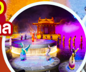
ชมโชว์อสังการ