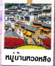
หมู่บ้านทวงหลิง