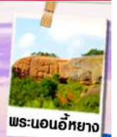
พระนอนอียาง