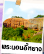
พระนอนอภัย