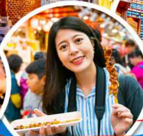
- ตลาดควางจั้ง