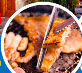
หมูย่างเกาหลี