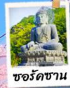
ชอร์ดชาน