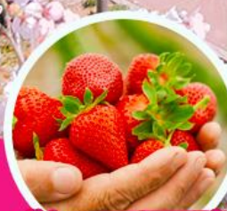
ไร้สตรอว์เบอร์รี่