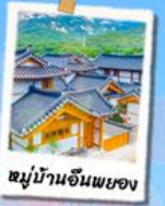
หมู่บ้านฮันพยอง