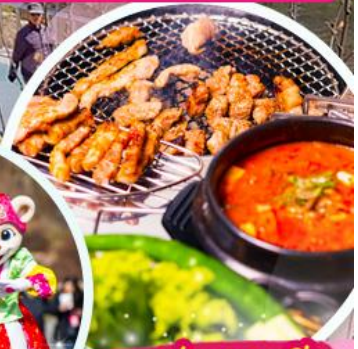
เมนูย่างเกาหลี