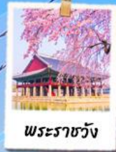
พระราชวัง