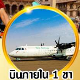
บินภายใน 1 ชม