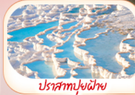
ปราสาทฟูยีฟาย