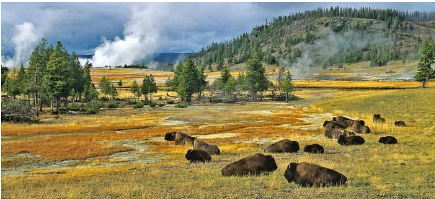
ใกล้เคียง

วันที่ห้าของการเดินทาง(5) เวสต์ เอลโล่ สโตน - อุทยานแห่งชาติแกรนด์ทีทอน เชียนบัฟฟาโล่ บิลด์ - เมืองโคดี้