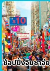
ช้อปปิ้งจิมซาจี้