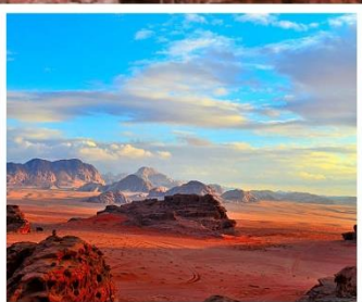
ทะเลทรายวาดี รัม