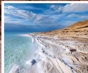
ทะเลสาบเดดซี