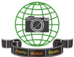
PHOTO WORLD TOURS