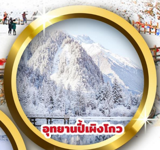
อุทยานปี้เผิงโกว