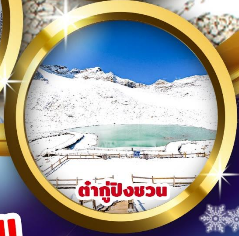
ต้ากู่ปิงชวณ