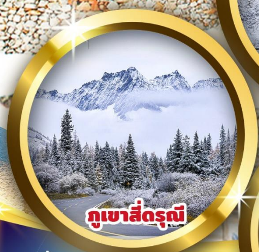
ภูเขาสี่ดรุณี