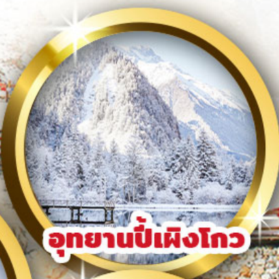
อุทยานปี้เฟิงโกว