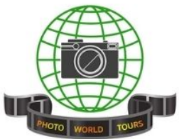
PHOTO WORLD TOURS