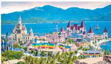
VinWonders NHA TRANG