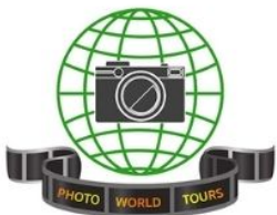
PHOTO WORLD TOURS