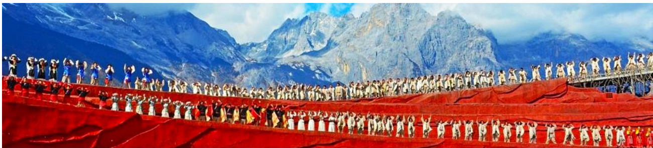
การแสดง IMPRESSION LIJIANG

นักแสดงกว่า 600 ชีวิต แสง สี เสียง การแต่งกายตระการตา เล่าเรื่องราวชีวิตความเป็นอยู่ และชาวเผ่าต่างๆ ของเมืองลี่เจียง