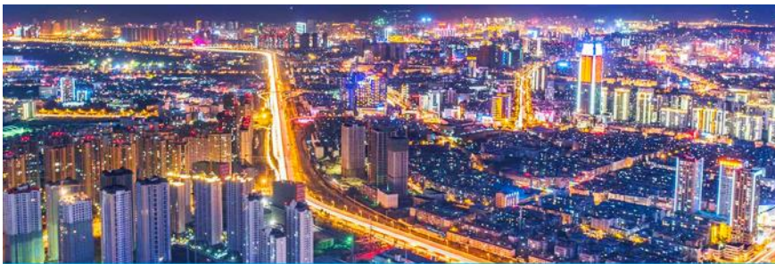
นครคุนหมิง