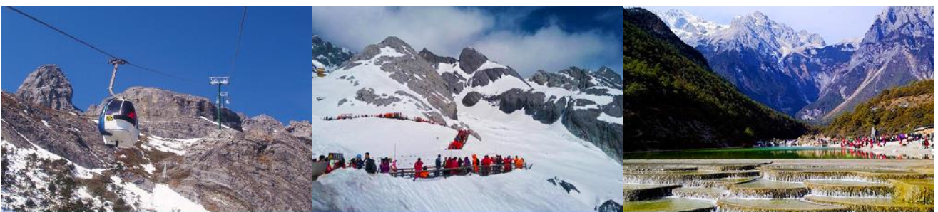
ภูเขาหิมะมังกรหยก (นั่งกระเช้าใหญ่)

ที่พัก FENG HUANG HOTEL ระดับ 4 ดาว หรือเทียบเท่าเมืองลี่เจียง