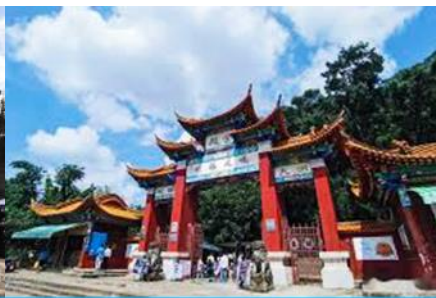
ตำหนักทงจินเตียน