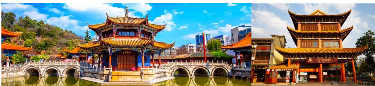
วัดหยวนทง

พักที่ FEI LONG HOTEL ระดับ 4 ดาว หรือเทียบเท่าในเมืองต้าหลี่