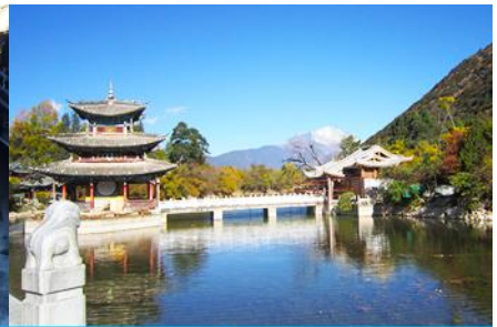
สระน้ำมังกรดำ

วันที่สาม จงเตียน-วัดลามะชงจ้านหลิง-ช่องแคบเสือกระโจน-ลี่เจียง-สระมังกรดำ-เมืองโบราณลี่เจียง