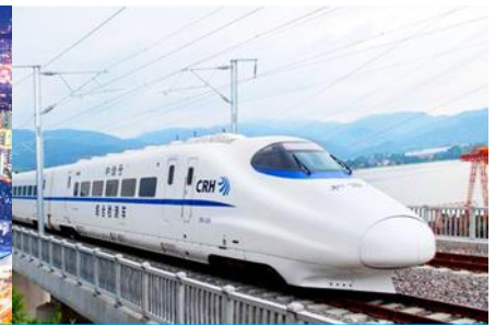
บริการไฟความเร็วสูง