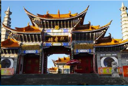
วัดเจ้าแม่กวนอิมเปลวกาย