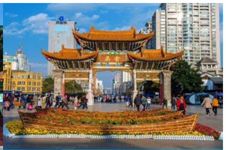
ซุ้มประตูโบราณ ม้าทง ไก่หยก

วันที่หก คุนหมิง - KUNMING WATERFALL PARK – ตำหนักทงจินเตียน - ซุ้มประตูโบราณ ม้าทง ไก่หยก - ร้าน POP MART (ตามหาบุญ) - กรุงเทพฯ (สุวรรณภูมิ)