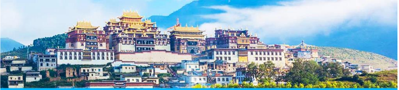
เมืองโบราณแซกริล่า

จากนั้นนำท่านเดินทางสู่ เมืองจงเตียน โดยใช้เส้นทางด่วนวิ่งตรงเข้าเมือง จงเตียน ใช้เวลาเดินทางประมาณ 2 ชั่วโมง สู่ เมืองจงเตียน หรือดินแดนแห่งแซกริล่า ซึ่งอยู่ทางทิศตะวันออกเฉียงเหนือของมณฑลยูนนานซึ่งมีพรมแดนติดกับอาณาเขตน่านซี ของเมืองลี่เจียง และอาณาจักรหยา ของเมืองหนิงหลง สถานที่แห่งนี้จึงได้ชื่อว่า ดินแดนแห่งความฝัน