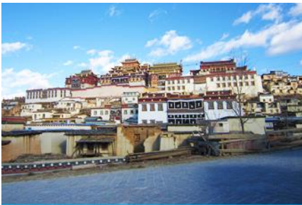
วัดลามะชงจ้านหลิง

ที่พัก GRACE HOTEL ระดับ 4 ดาว หรือเทียบเท่าเมืองจงเตียน หรือแซกริล่า