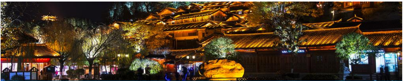
เมืองโบราณลี่เจียง