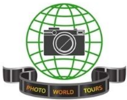
PHOTO WORLD TOURS