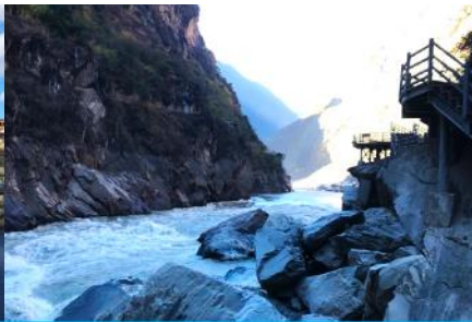
ช่องแคบเสือกระโจน