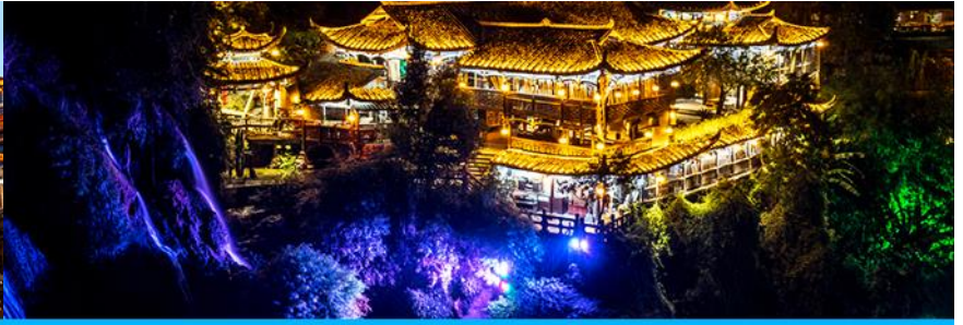
เมืองโบราณฟูหวงเจิน

วันที่สาม เมืองจางเจียเจี๋ย-ตึกมหัศจรรย์ 72 ชั้น-นอนในเมืองเก่าโบราณฟูหวงเจิน-เต็มอิ่มแสงสี ยามค่ำกิน ออฟชั่นไกด์ขายโปรแกรม เขาเทียนเหมินซาน กระเช้าขึ้นลง ประตูลู่วรรค บันไดเลื่อนทะเลภูเขา