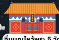
อิมบูนไหว้พระ 5 วัด