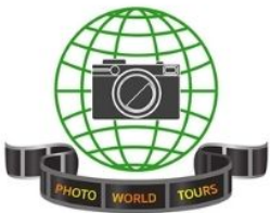
PHOTO WORLD TOURS