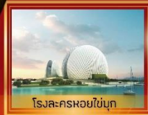
โรงละครหอยไข่มุก