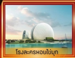
โรงละครหอยไข่มุก