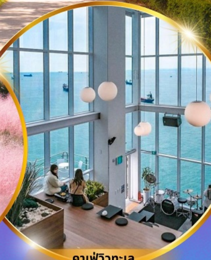
คาเฟ่วิวทะเล

ถ่ายรูปชิคๆ หมู่บ้านวัฒนธรรมคิมซอน ใหม่ล่าสุด คาเฟ่ริมทะเล วิวหลักล้าน ชมอุโมงค์ดินเมเปิ้ล สีส้มแดง ถ่ายรูปกับหญ้าสีชมพู สดใส ขึ้นเคเบิลคาร์ ชมทะเลปูซาน ห้ามพลาด!! ตลาดปลาที่ใหญ่ที่สุด ชิมของอร่อยที่ตลาดแฮจุนแด อิสระช้อปปิ้ง Lotte Duty Free