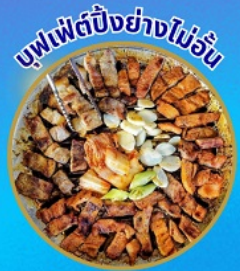
บุฟเฟ่ต์ปิ้งย่างไม่ร้อน