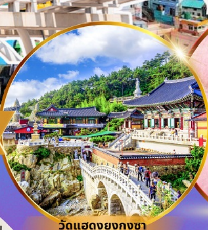
วัดแสดงยงกุงซา