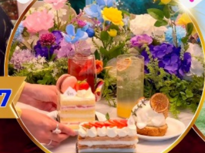
คาเฟ่ดัง Forest Outing