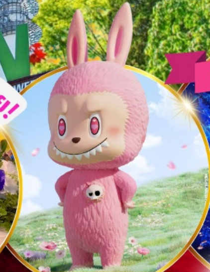
Pop Mart สงแด