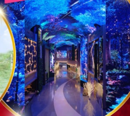
INSPIRE Entertainment Resort