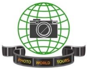
PHOTO WORLD TOURS