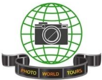
PHOTO WORLD TOURS & TRANSPORT LTD.,PART

1/109 Moo 9 Soi Pibulsongkram 6, Pibulsongkram Rd., Nonthaburi 11000